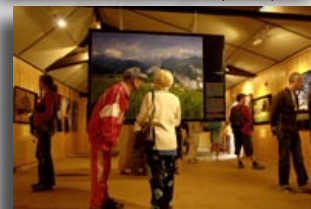
Parc Régional d'Armorique - été 2006