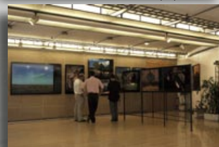
Hôtel de région Poitou Charentes - printemps 2007