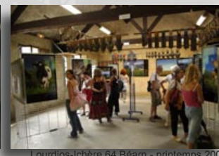
Lourdiós-Ichère 64 Béarn - printemps 2007