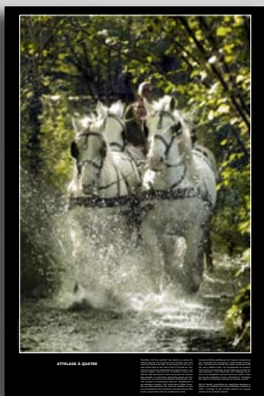
Attelage Percheron. Original 80x120cm

www.animaux-de-terroir.org : vous parle de vaches, chevaux, chèvres, moutons, cochons, ânes et mulets. Des territoires passés et présents qui ont aidé à façonner ce patrimoine culturel vivant. Mais également et surtout de ceux qui chaque jour font vivre et accompagnent l'évolution de ces animaux : les éleveurs.