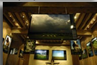
Parc Régional du Perche - printemps,été 2008