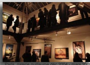
Paris, galerie guillaume déc 2004 - mars 2005

Observation, analyse et mise en image des savoir-faire locaux en matière d'élevage, de races locales et d'aménagement de l'espace rural. Examen des enjeux et mise en exergue du potentiel de développement durable qu'ils représentent.